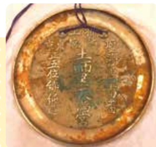
▲神鏡は高槻市立しろあと歴史館で大切に保管されている

武四郎は71歳で人生の旅を終えるまで、道を歩き続けました。晩年は全国25の天満宮を巡り、石碑を建て、神鏡を奉納しました。高槻市にも、上宮天満宮に石碑と神鏡を奉納しています。神鏡は、しろあと歴史館が保管していますが、武四郎の名が刻まれた石碑は、今も上宮天満宮の境内に建っています。おまいりの際に、ぜひ石碑を探してみてください。