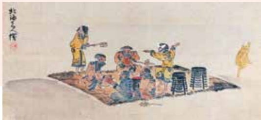
神に祈りを捧げるアイヌの人々