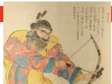
弾弓式の図（蝦夷漫画より）

武四郎は、13年をかけてアイヌの協力のもと、蝦夷地調査を成し遂げました。伊能忠敬や間宮林蔵が測量できなかった、蝦夷地の内陸部をくまなく歩き、山や川や湖などを地図に書き込みました。記された多くの地名（サッポロ、ワッカナイ、オタルなど）は、276名から聞き取った9,800ものアイヌ語であらわされたものです。後に、遠く離れた蝦夷地の独自の文化と、自然の中で巧みに生きる姿を紀行文や蝦夷漫画として出版し、アイヌ民族の生命と文化を守ることに力を注ぎました。