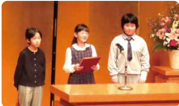
各部門の最優秀賞受賞者によって、高槻市人権擁護都市宣言文が読み上げられました

人権課題を一人ひとりが自分の事として捉え、お互いの人権を尊重し合う高槻市を築くことを目的に人権啓発作品を募集したところ、作文607点、標語3,694点、絵画98点、合計4,399点もの応募がありました。選定の結果、下記の皆さまが入選されました。