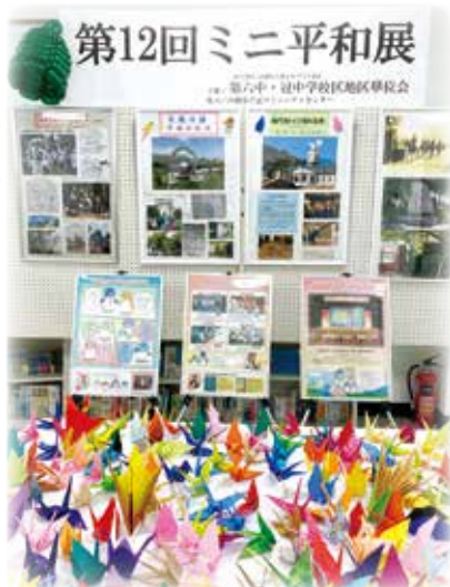
第12回ミニ平和展の様子

争いや、戦争がなく、差別せず、違いを認め合い、悪口を言ったり、 けんかをせず、みんなが笑顔になるまちづくりを目標にしてい ます (第14回ミニ平和展より)