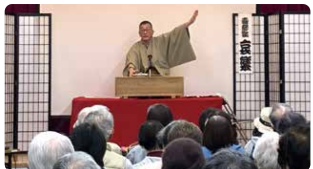
▲阿武野・阿武山中学校区地区単位会 「優しさは笑顔から」先行き不透明な社会を笑顔で乗り切ろう！目の前で見る本格的な落語は迫力満点