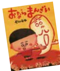
ユーモラスでおおらかな絵は大人から子どもまで大人気

申込方法 ①来所 ②☎647-7825 (①②は平日8:45～17:15) ③FAX647-7233 ④HP (③④は毎日24時間受付)