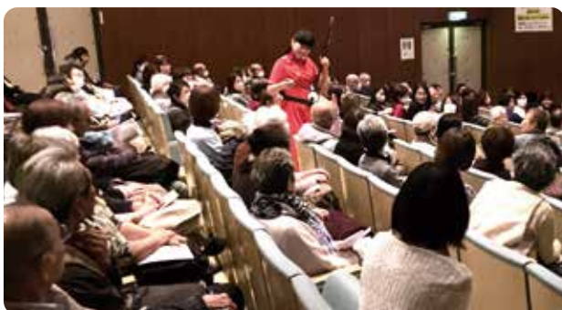
▲主催：第三中学校区地区単位会 共催：第四中・如是中学校区地区単位会 珍しい二胡の演奏に、会場は超満員。参加者も登壇して合奏を楽しみ、場内は大盛り上がり