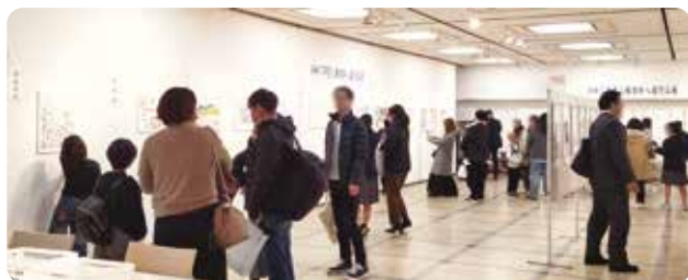
市立生涯学習センター入選作品展示会場にて (令和7年12月12日～13日)